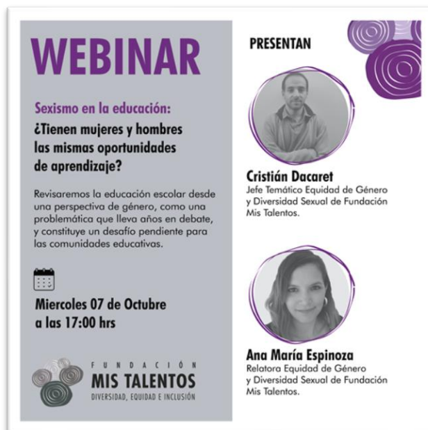
Pieza gráfica para redes sociales de uno de nuestros webinar