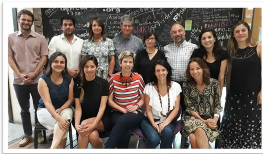
Equipo Acción Colectiva Por la Educación

Acción Colectiva es una agrupación compuesta por 20 organizaciones de la sociedad civil trabajando por la educación, que apuntan a la transformación e innovación en escuelas y comunidades educativas a lo largo del país.