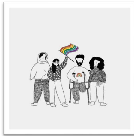
Parte de nuestras ilustraciones generadas el 2020