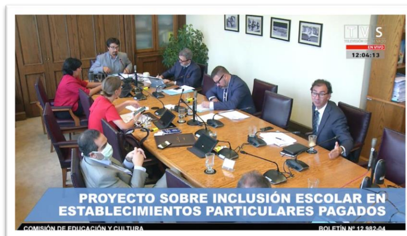
Presentación Fundación Mis Talentos ante la Comisión de Educación del Senado

4. Incidimos en proyecto de ley que elimina evaluaciones previas a la admisión de Programa de Integración Escolar (PIE) en el Sistema de Admisión Escolar (SAE).